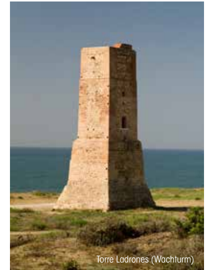
Torre Ladrones (Wachturm)

In der Umgebung der Artola Dünen befindet sich der Turm der Diebe, ein Zeugnis militärischer Architektur und Abwehr, der zum "Bien de Interés Cultural" (Gut von kulturellem Interesse) erklärt wurde. Er scheint ursprünglich aus