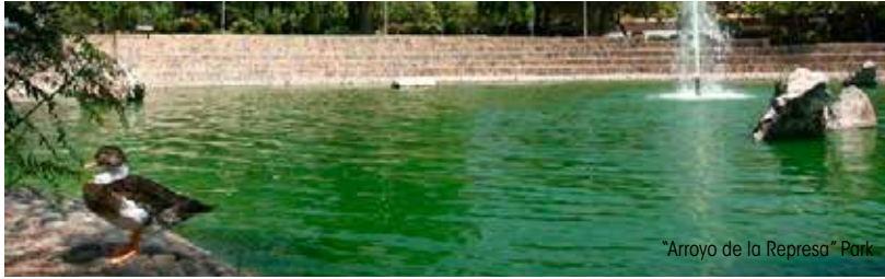
"Arroyo de la Represa" Park

Die vorherrschenden Winde aus nordöstlicher Richtung und die Küstenströmungen haben unaufhörlich sandiges Material herangetragen bis sich eine Dünenkette bildete, die einst eine Länge von etwa 20 km einnahm. Heute zeugen die Dünen von Artola als natürliches Denkmal noch von dem, was die Küste von Málaga in vergangenen Zeiten einmal war.