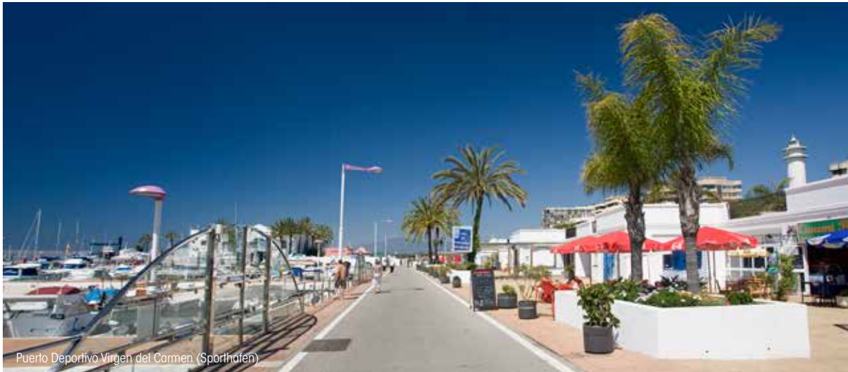
Puerto Deportivo Virgen del Carmen (Sporthafen)