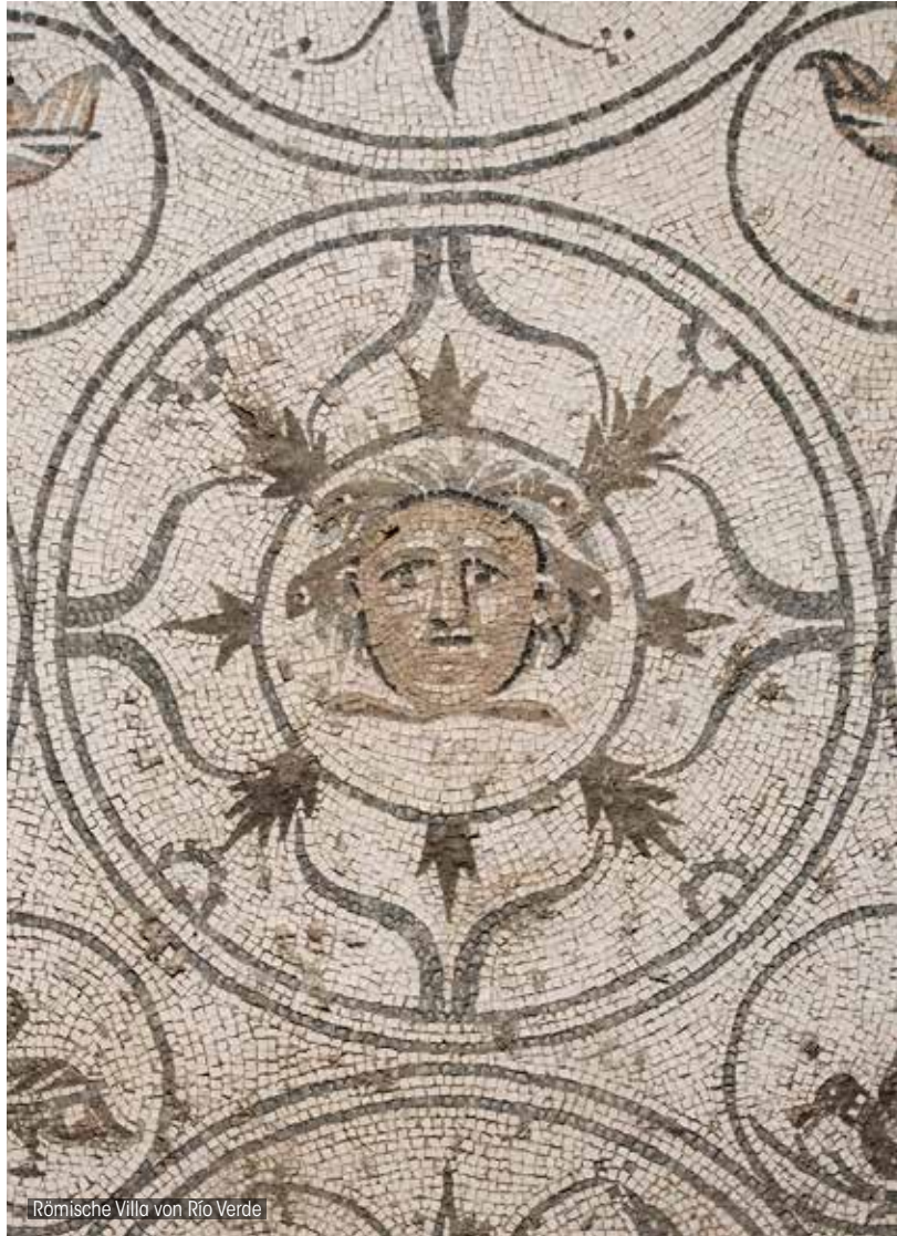
Römische Villa von Río Verde

RÖMISCHE VILLA VON RÍO VERDE: Hierbei handelt es sich um eine Villa, die im 1.-2. Jahrhundert n. Chr. gebaut wurde. In einem der Häuser, das einst aus mehreren Räumen bestand, die um den mit Säulen und Portiken umgebenden Innenhof angeordnet waren, gibt es einen prächtigen Mosaikboden. Es sticht ein musischer Komplex von höchster Qualität und sehr unterschiedlichen Themen hervor, der das Pseudo-Peristyl und die Nebenräume schmückt.