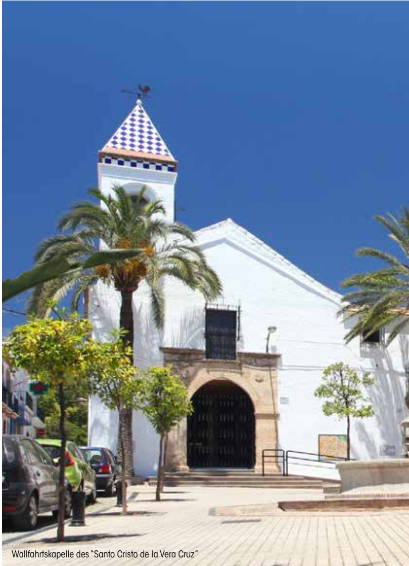
Wallfahrtskapelle des "Santo Cristo de la Vera Cruz"

Baumaßnahmen durchgeführt und dadurch entstand die Kirche so, wie wir sie heute kennen. Es war um 1750, als der ruinöse Zustand es zwingend erforderlich machte, das Gotteshaus neu zu bauen.