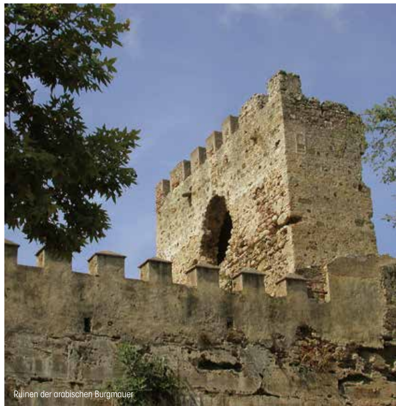
Ruinen der arabischen Burgmauer

Wir können annehmen, dass mit dem Bau der Burg im 10. Jahrhundert (Zeitalter der Kalifen) begonnen und dass sie im 14. Jahrhundert (Nazari Dynastie) vergrößert wurde. Dafür wurde Baumaterial weiterverwendet, das aus irgendeinem nahe gelegenen römischen Bauwerk stammte, und das bezeugen die drei ionischen Kapitelle (in der Straße Trinidad), die als einfache Steine benutzt worden waren.