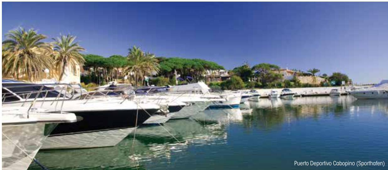
Puerto Deportivo Cabopino (Sporthafen)

PUERTO DEPORTIVO CABOPINO: Er ist besonders bei den Touristen in der Gegend östlich von Marbella beliebt und bekannt als kleiner, gemütlicher und intimer Yachthafen. Er hat 169 Liegeplätze und zu seinen Reizen gehören Bars, spanische und internationale Restaurants und ruhige Strände mit feinem Sand, die von einer wunderschönen Landschaft aus Dünen und Pinienwäldern eingrenzt sind.