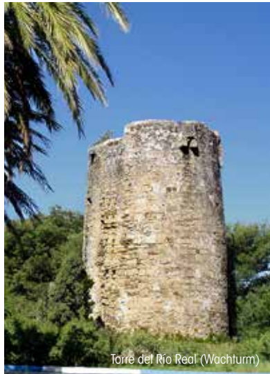
Torre del Río Real (Wachturm)

RÖMISCHE THERME: Sie wurden im 2. Jahrhundert n.Chr. gebaut. Ein Großteil von der Struktur des Gebäudes hat die Zeit gut überstanden, dank der Verwendung einer Felsblock-Verschalung und eines Kalkmörtels von sehr guter Qualität. Sie besteht aus zwei Etagen, dessen Räumlichkeiten sich um einen oktogonalen Hauptraum anordneten.