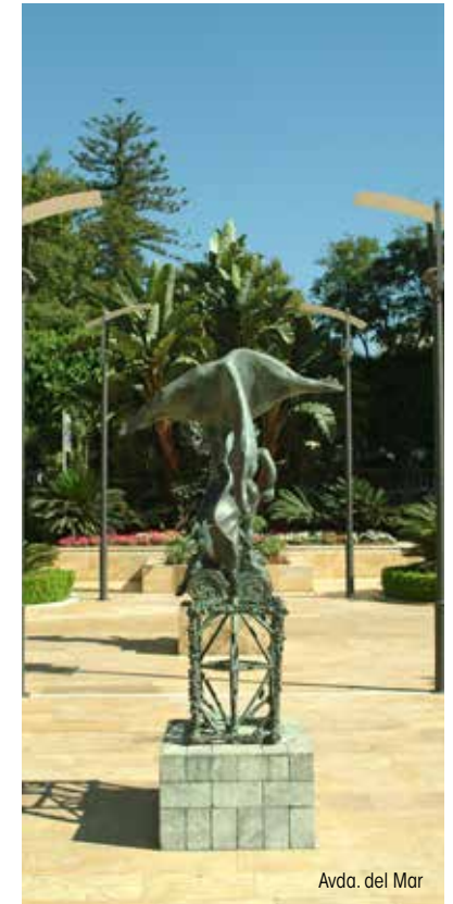
Avda. del Mar