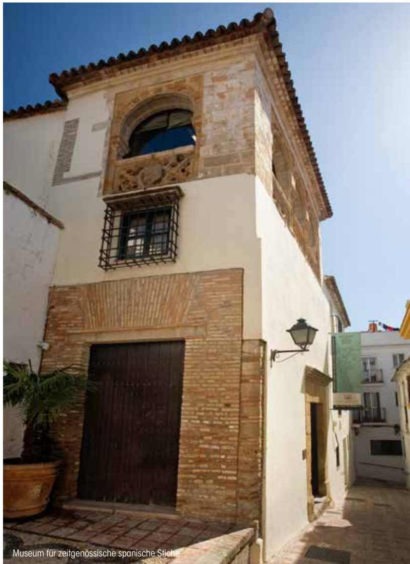
Museum für zeitgenössische spanische Stiche