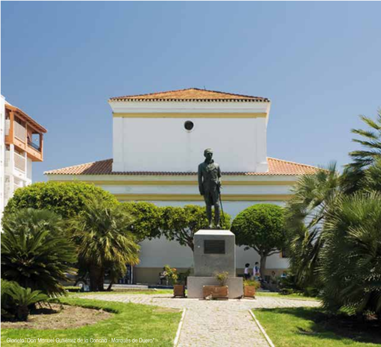
Glorieta "Don Manuel Gutiérrez de la Concha - Marqués de Duero"

Neue Methoden des landwirtschaftlichen Anbaues wurden eingeführt, tausende Hektar Land wurden gerodet und trockengelegt, Staudämme mit einem wirkungsvollen Bewäs-