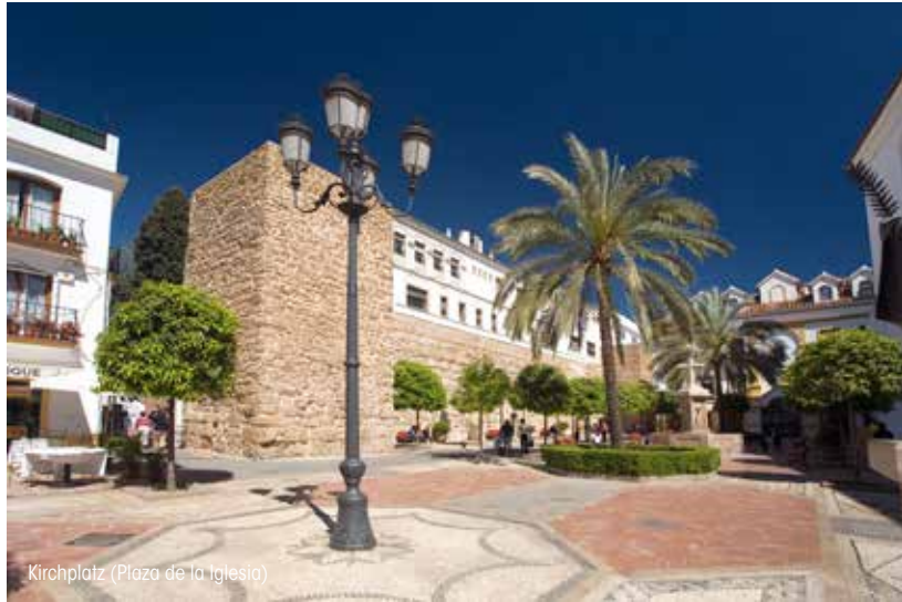
Kirchplatz (Plaza de la Iglesia)