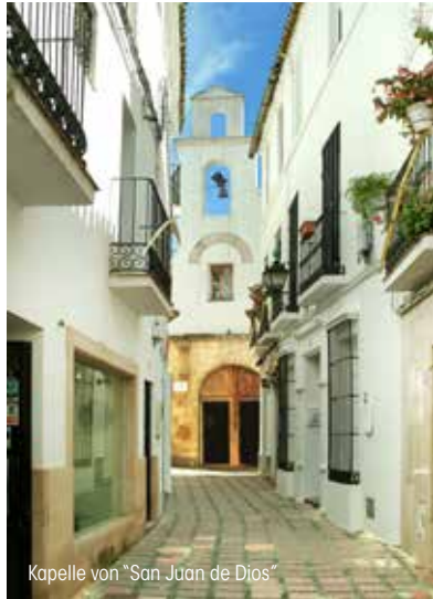
Kapelle von "San Juan de Dios"

KAPELLE VON SAN JUAN DE DIOS: Ihre Erbauung datiert aus den Anfängen des 16. Jahrhunderts. Sie besteht aus einem einzigen Schiff mit einer schönen dreiteiligen Holzverkleidung, die durch doppelte Streben verstärkt ist. Die Kuppeln sind nicht geometrisch dekoriert, sondern mit eucharistischen Symbolen wie dem Kelch. Diese Elemente zeugen von einem allmählichen Verblässen der mudejarischen Tradition.