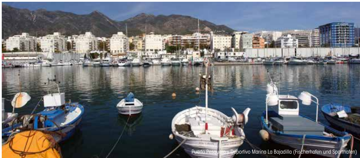
Puerto Pesquero y Deportivo Marina La Bajadilla (Fischerhafen und Sporhafen)

PUERTO DEPORTIVO CABOPINO: Er ist besonders bei den Touristen in der Gegend östlich von Marbella beliebt und bekannt als kleiner, gemütlicher und intimer Yachthafen. Er hat 169 Liegeplätze und zu seinen Reizen gehören Bars, spanische und internationale Restaurants und ruhige Strände mit feinem Sand, die von einer wunderschönen Landschaft aus Dünen und Pinienwäldern eingrenzt sind.