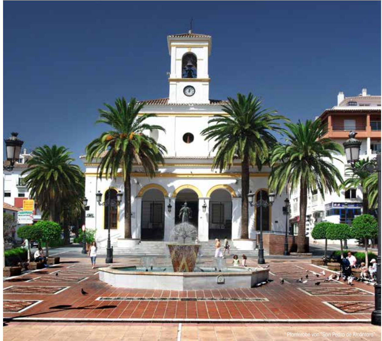
Pfarrkirche von "San Pedro de Alcántara"

San Pedro Alcántara hat viele Attraktionen wie zum Beispiel das Zentrum , die bezaubernde Fußgängerzone, die Strandpromenade , die Strände oder die Allee Avda. del Mediterráneo sowie alle ihre gepflegten Straßen, in denen man jegliche Art von Geschäften und Dienstleistungen finden kann. Besonders hervorzuheben sind die Pfarrkirche , das Kulturzentrum El Ingenio , die römischen Gewölbe oder Thermen sowie die frühchristliche Basilika .