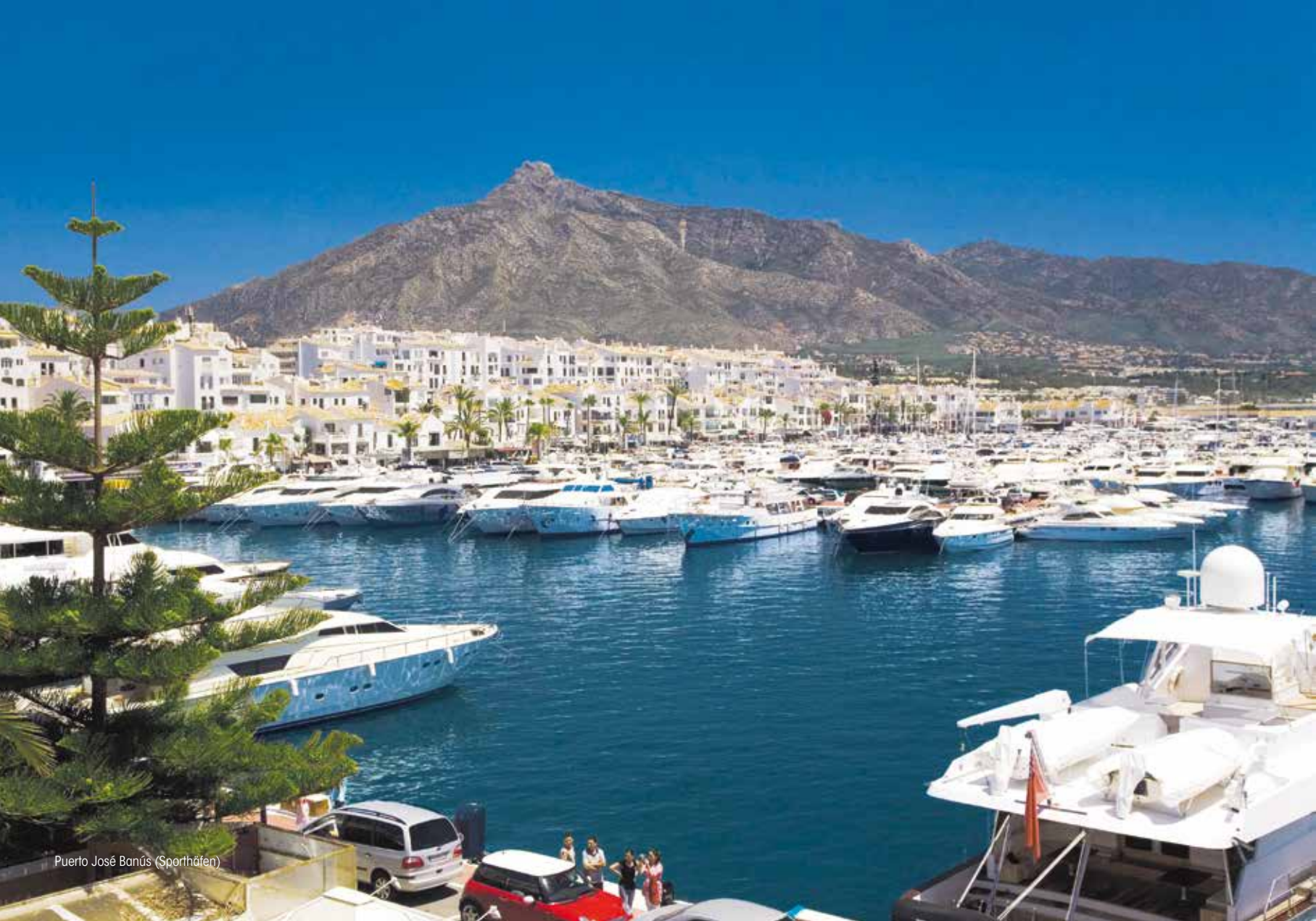
Puerto José Banús (Sporthafen)