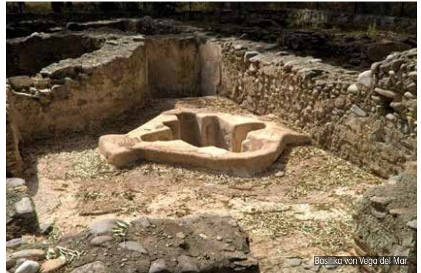
Basilika von Vega del Mar

BASILIKA VON VEGA DEL MAR: Mit mehr als 1.500 Jahren ist sie ohne Zweifel eine der bril-