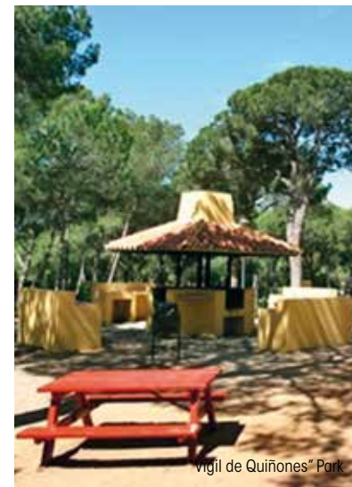
vigil de Quiñones* Park