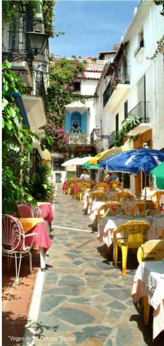
"Virgen de los Dolores" Strasse