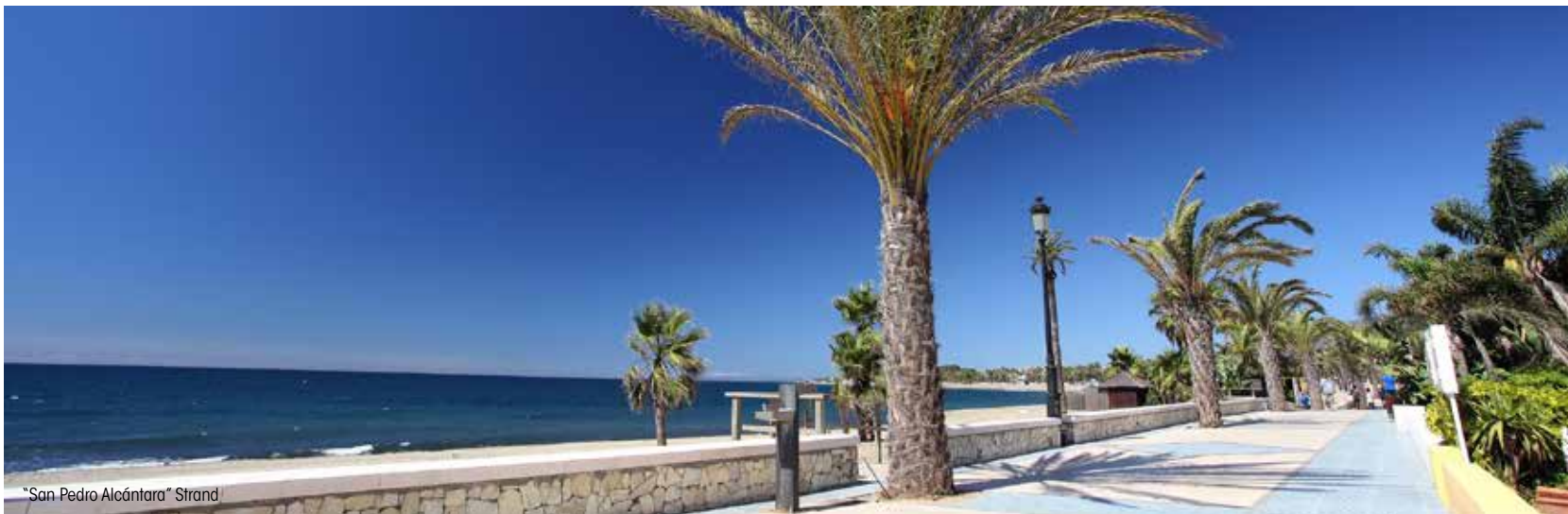
"San Pedro Alcántara" Strand