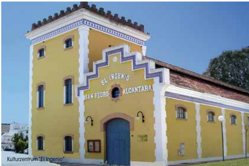
Kulturzentrum "El Ingenio"

PFARRKIRCHE VON SAN PEDRO DE ALCÁNTARA: Die Pfarrstätte wurde im Jahr 1866 von dem Marquis del Duero gebaut, nach den Bränden von 1936 restauriert und schließlich 1943 wieder für die Gläubigen eröffnet. Sie befindet sich mitten im Herzen von San Pedro, auf einem Marktplatz dem sie seinen Namen gibt, und war eines der ersten Gebäude des großen Bauvorhabens des Marquis. Sie ist ein repräsentatives Beispiel der kolonialen Architektur. Besonders hervorzuheben sind ihre Fassade, ihr anmutiger Säulenvorbau sowie die klare Reinheit ihrer Baulinie.