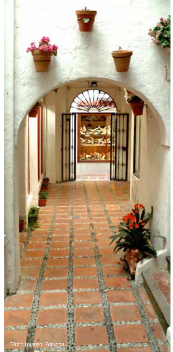
"Paco Lorenzo" Passage