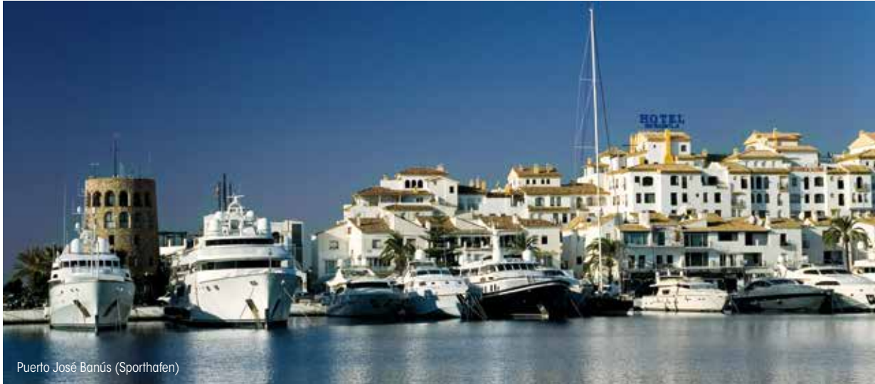
Puerto José Banús (Sporthafen)