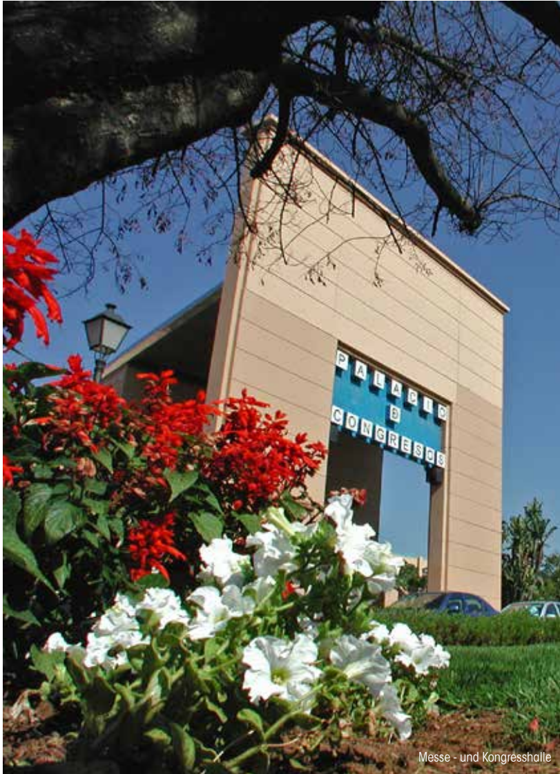
Messe- und Kongresshalle

Die zahlreichen Hotels sowie das Stadttheater und die moderne Kongress-, Messe- und Ausstellungshalle machen Marbella zu einem idealen Ort für das Ausrichten derartiger Veranstaltungen.