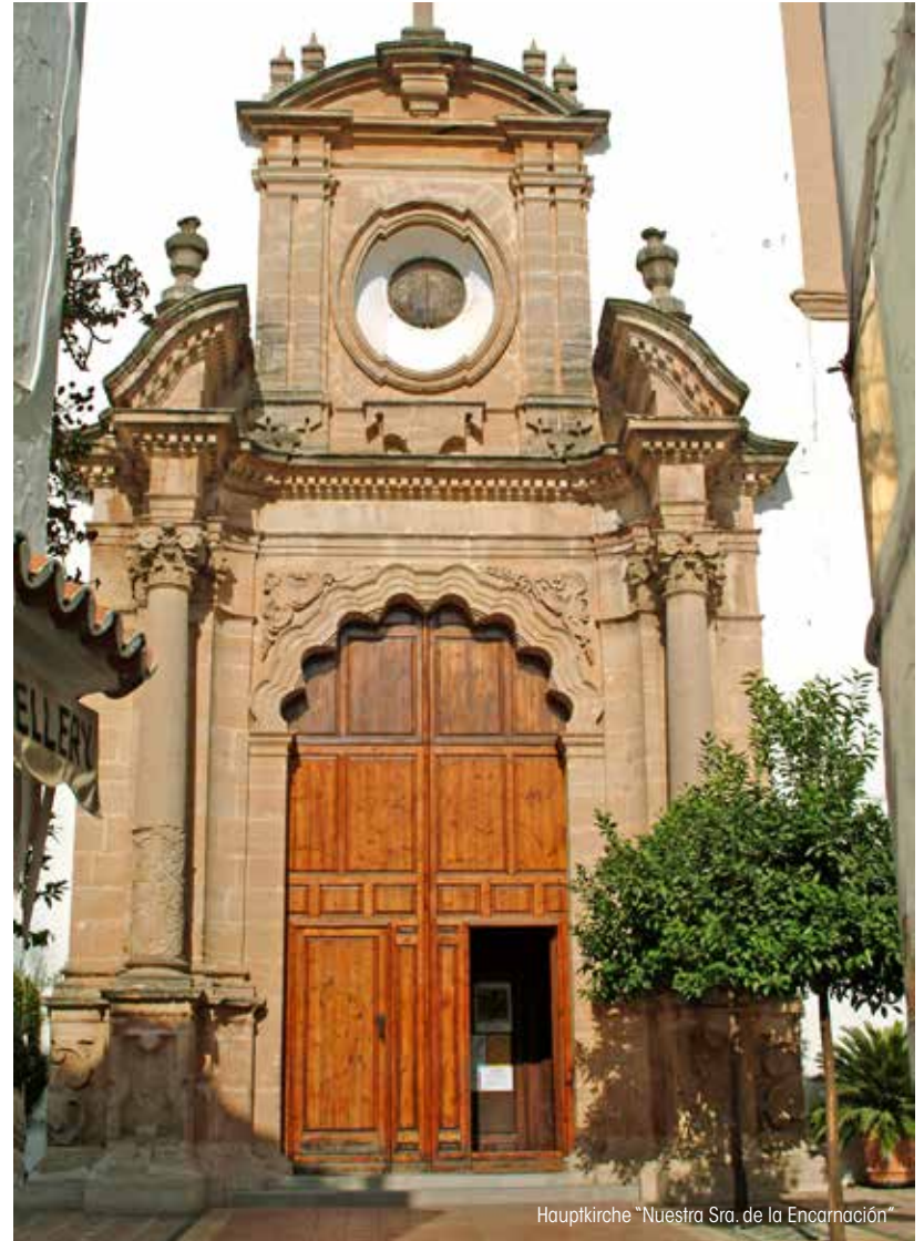
Hauptkirche "Nuestra Sra. de la Encarnación"

Die Kirche war ehemals eine Moschee, die am 11. Juni 1485, nach der Wiedereroberung der Stadt, von den Katholischen Königen geweiht wurde. Das ist wohlbekannt aber nicht bewiesen. Wahrscheinlich waren die für eine Moschee gegebenen Voraussetzungen nicht für den Gottesdienst geeignet oder vielleicht wurde man zwischen 1517 und 1518 durch den schlechten Erhaltungszustand zu einem Neubau oder zu Renovierungsarbeiten von erheblichem Ausmaß gezwungen. Im Laufe des 17. und 18. Jahrhunderts wurden verschiedene