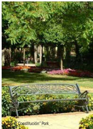
De la Constitución* Park

Besondere Erwähnung verdient die prächtige STRANDPROMENADE für Fußgänger,