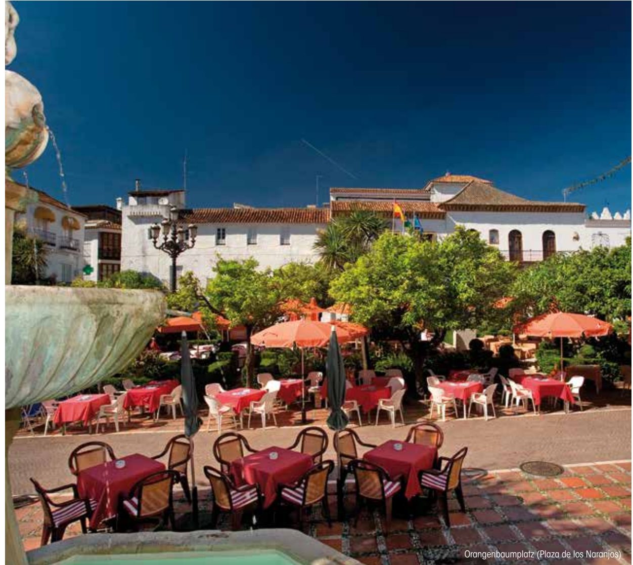
Orangenbaumplatz (Plaza de los Naranjos)

Marbella hat sich zu einer Stadt entwickelt, die man als eine Referenz für den Tourismus weltweit bezeichnen kann, ohne dabei ihre typisch andalusische Würze oder ihre historische Quintessenz eingebüßt zu haben. Meer und Berge, Tradition und Modernität vereinen sich in dieser Stadt am Mittelmeer und bieten damit dem Besucher ein Ambiente aus einer Vielfalt von Nuancen und Kulturen, kosmopolitisch und offen für den Fortschritt und eine Lebensform, die sich auf das Miteinander und den einladenden Charakter ihrer Menschen gründet. Ihr reiches und mannigfaltiges Angebot erlaubt es, die Bedürfnisse des anspruchvollsten Publikums zu erfüllen. 28 Kilometer Strand, eine traumhafte Bergwelt, Golfplätze, Luxushotels, 4 Yachthäfen, unter denen der weltweit bekannte Puerto Banús hervorsticht, moderne Einkaufszentren, beste Möglichkeiten für Kongressveranstaltungen und ein intensives Nachtleben sind nur einige der Reize dieser Enklave, die sich durch ihr phantastisches Mikroklima und ihr auserlesenes Ambiente auszeichnet.