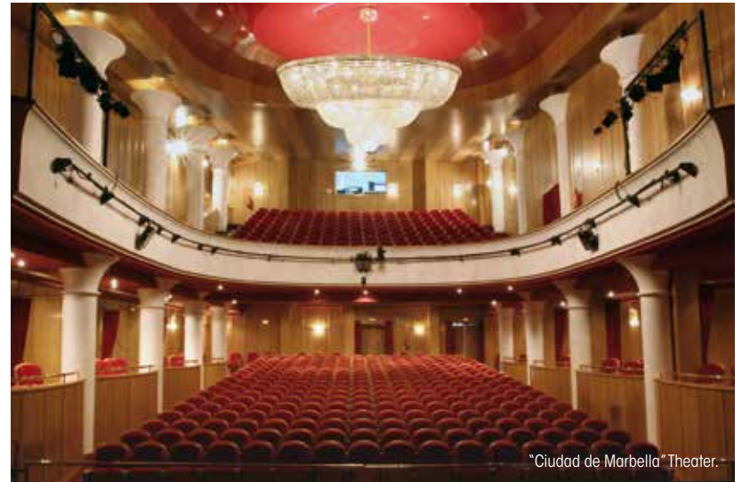
"Ciudad de Marbella" Theater