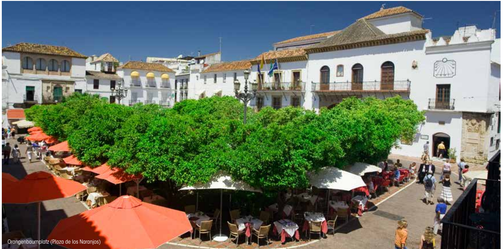
Orangenbaumplatz (Plaza de los Naranjos)

Anlagen nach der Wiedereroberung nach der in kastilischen Städten herrschenden Tradition gestaltet wurde, in diesem Fall allerdings ohne Bogengänge. Hier befinden sich auch das einstige Haus des Vertreters der Krone (la Casa del Corregidor), das Rathaus und die Ermita de Santiago (Wallfahrtsklausen des Hl. Jakob).