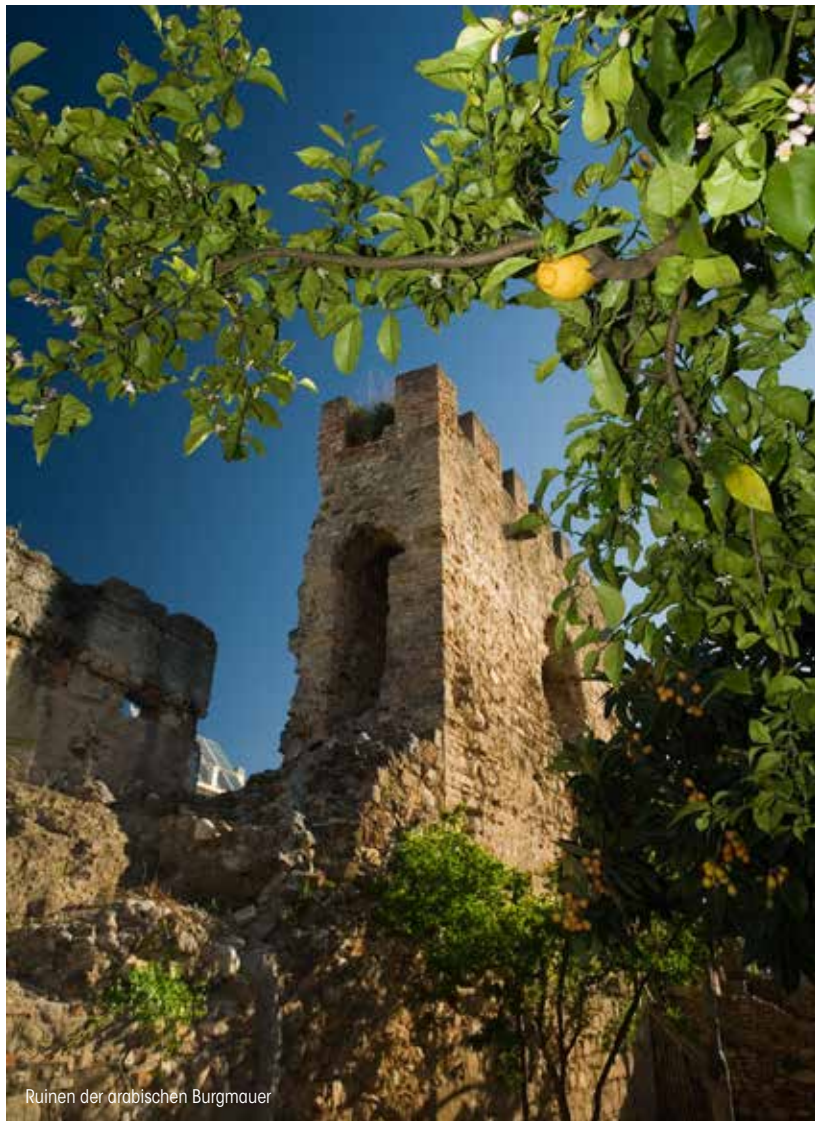
Ruinen der arabischen Burgmauer

Geschützt durch einen Gürtel von Mauern und Türmen, verbanden im islamischen Marbella einige wenige, stark gewundene Querstraßen die meistbenutzten Eingangstore zu dem Bezirk, der innerhalb des Walls lag.