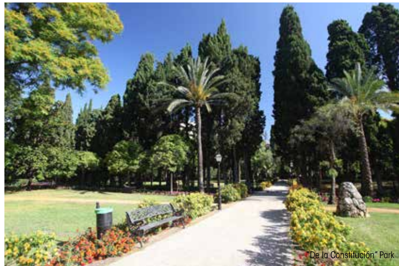
De la Constitución* Park

JARDÍN BOTÁNICO EL ÁNGEL: Der botanische Garten liegt in der ehemaligen Siedlung "El Ángel" in der Nähe der Schule Aloha. Seine Hauptattraktion besteht in dem Reichtum und Alter der dort wachsenden Bäume.